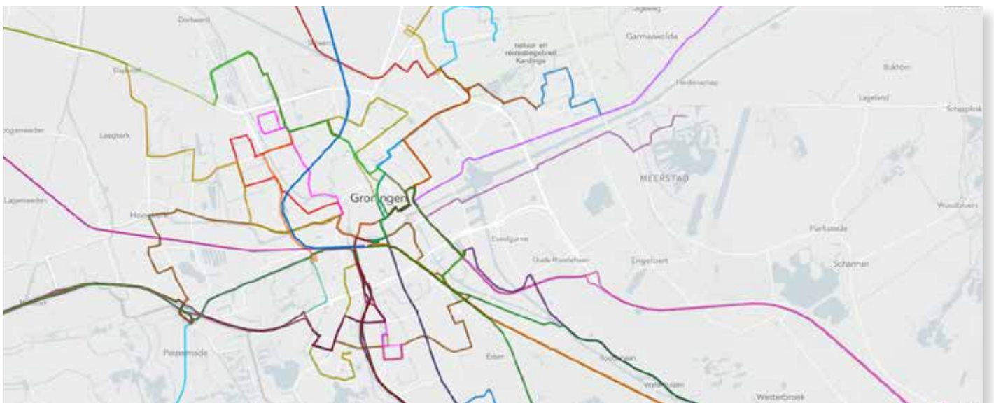
Kaartweergave van de regionale buslijnen rondom Groningen en Oldenburg-Bremen.

Landesnahverkehrsgesellschaft Niedersachsen (LNVG) en OV-bureau Groningen Drenthe brengen we in kaart wat nodig is om de aansluiting tussen bus en trein te verbeteren. Dit moet de komende jaren leiden tot een groter aanbod en een betere aansluiting van regionale buslijnen op de Wunderline. Zo wordt het voor inwoners van de regio nóg aantrekkelijker om gebruik te maken van het openbaar vervoer en van de Wunderline in het bijzonder.